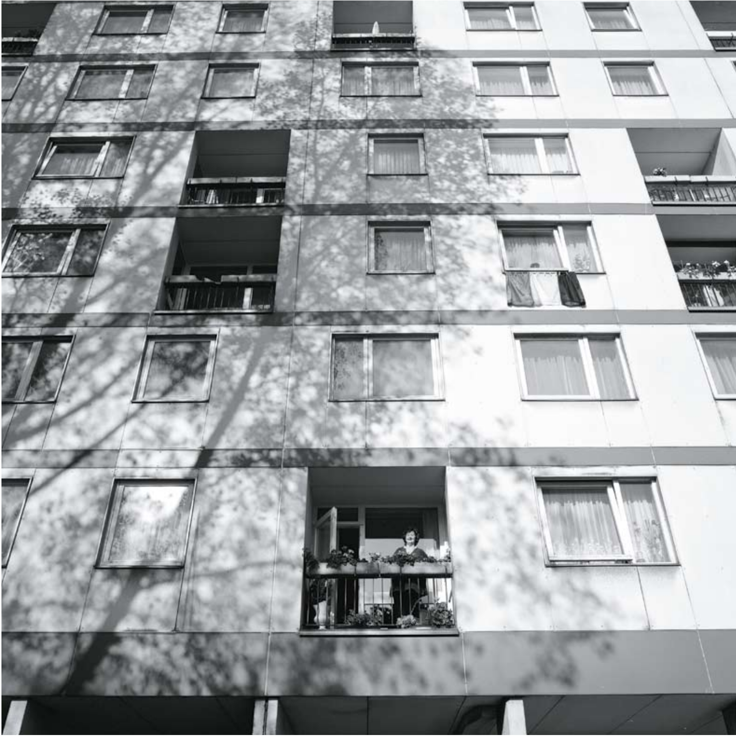
Assam - Parc du Peterbos, Immeuble 2 Assam - Peterbospark, Gebouw 2