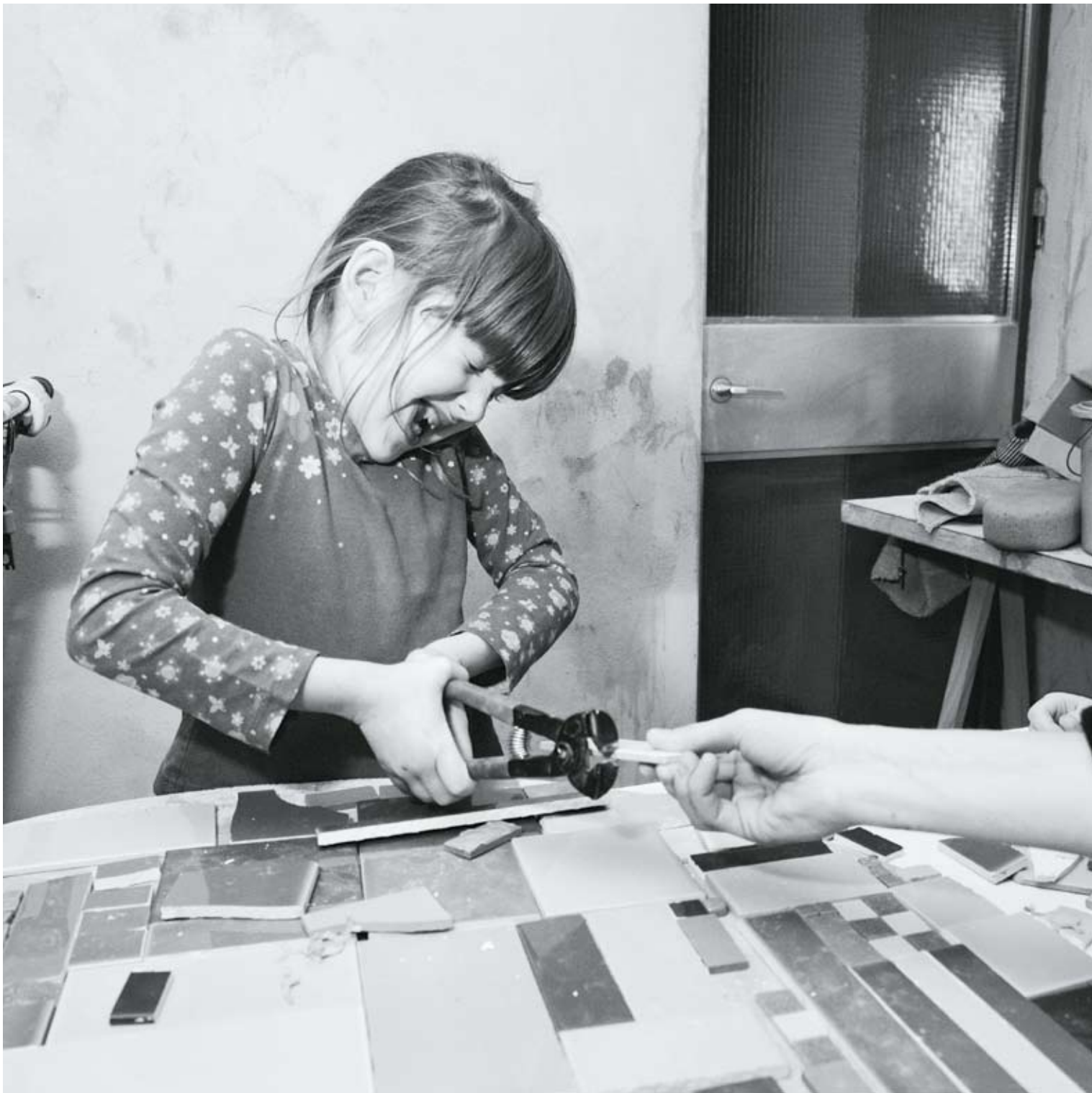
ASSAM - Peterbos 2, de bewoners maken de nummers van de verdiepingen met tegelscherven ASSAM - Peterbos 2, fabrication des numéros d'étages par les habitants avec les chutes de carrelages