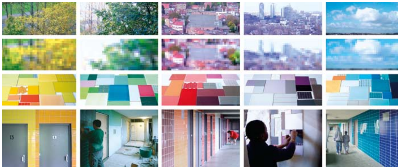
Parc de Peterbos - Immeuble 2, vues des étages, déclinaison des images en pixels, proposition de carrelages, couloirs carrelés - Lucile Soufflet.